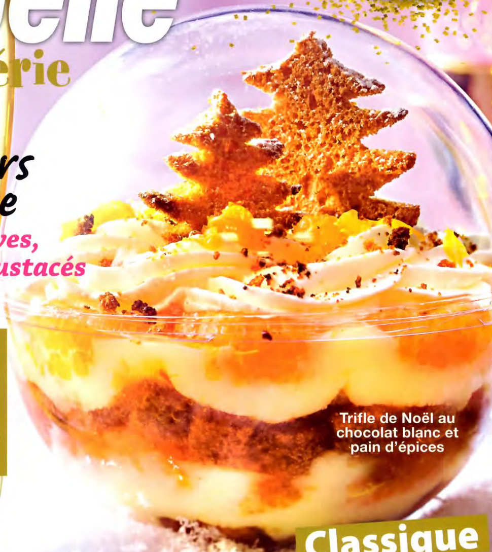
Trifle de Noël au chocolat blanc et pain d'épices