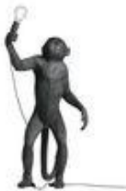
Lampe singe Seletti