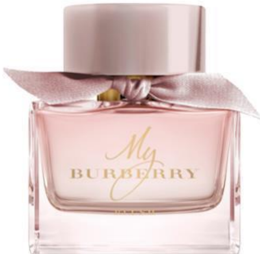
L'eau de parfum My Burberry Blush de Burberry