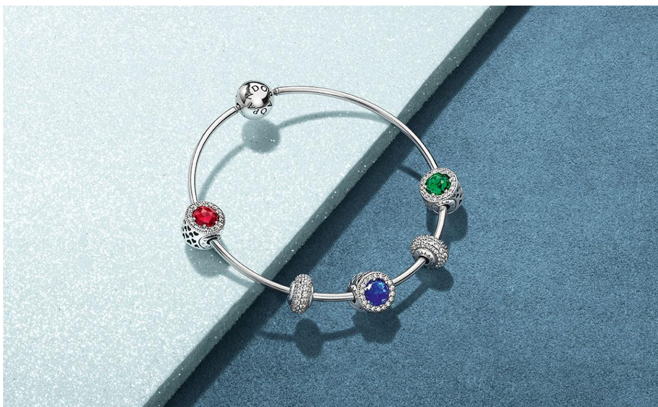
Bracelet avec charms Pandora